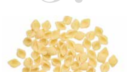
le Classiche Conchigliette trafilata al bronzo