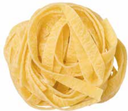
le Speciali Tagliatelle trafilata al bronzo