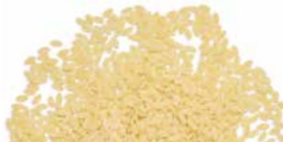
le Classiche Pasta a Riso trafilata al bronzo