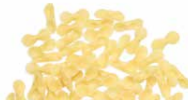
le Classiche Farfalline trafilata al bronzo