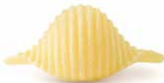
le Classiche Conchiglie Rigate trafilata al bronzo