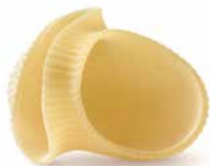
le Speciali Lumaconi trafilata al bronzo