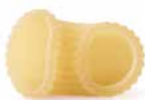
le Classiche Chifferi Rigati trafilata al bronzo