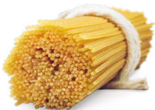
le Gluten Free Spaghetti trafilata al bronzo