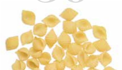
le Classiche Conchigliette Rigate trafilata al bronzo