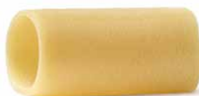
PACCHERI REALI --Trafilatura al Bronzo--