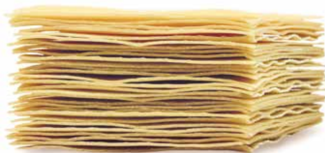
le Speciali Lasagne Semola trafilata al bronzo