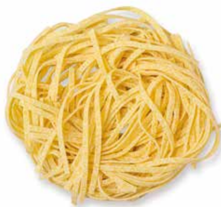
TAGLIERINI ALL'UOVO --Trafilatura al Bronzo--