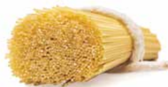
le Classiche Spaghetтини n°16/A trafilata al teflon