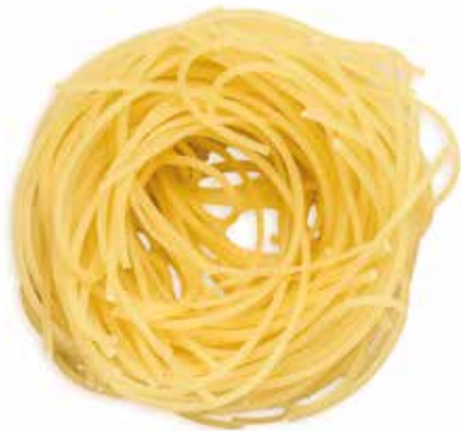
le Speciali Capelli d'angelo trafilata al bronzo