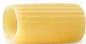
le Classiche Mezzi Rigatoni trafilata al bronzo