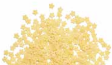
le Classiche Stelline trafilata al bronzo