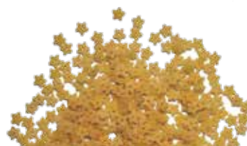
le Integrali Stelline trafilata al bronzo