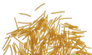
le Integrali Capellini Spezzati