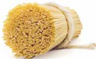
le Classiche Mezze Linguine trafilata al bronzo