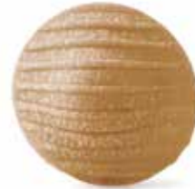
le Integrali Orecchiette Pugliesi trafilata al bronzo