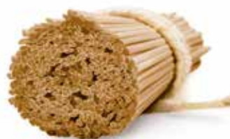
le Integrali Linguine trafilata al bronzo