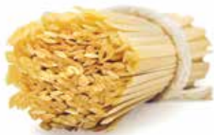
le Classiche Fettuccine trafilata al bronzo