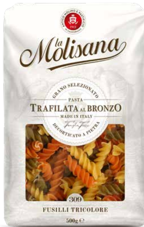
le Sfiziose Fusilli Tricolore trafilata al bronzo