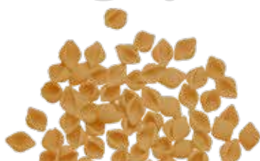
le Integrali Conchigliette trafilata al bronzo