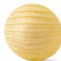
le Classiche Orecchiette Pugliesi trafilata al bronzo