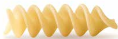
le Classiche Fusilli trafilata al bronzo