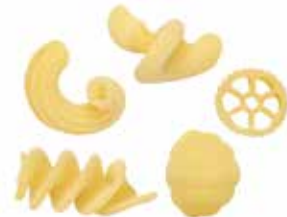
le Classiche Insalata di Pasta trafilata al bronzo