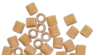
le Integrali Ditaloni Rigati trafilata al bronzo