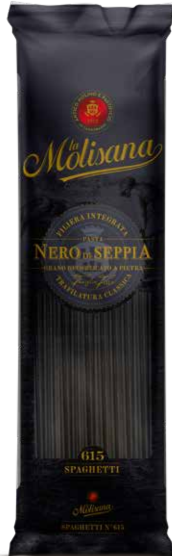
le Sfiziose Spaghetti Nero di Seppia trafilata al bronzo

Per gli amanti delle cucine esotiche, un ottimo cous cous facile e veloce da preparare. Disponibile nelle versioni da 500 g e da 1000 g.