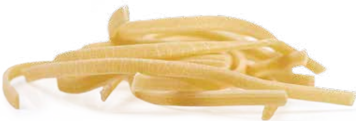
le Speciali Scialatielli trafilata al bronzo