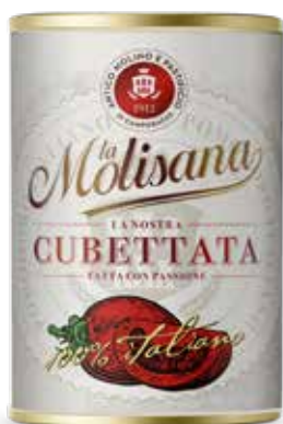
i Rossi Cubettata 📦 400 g

Questi pomodorini cilieгинi crescono nel Tavoliere delle Puglie , hanno un colore rosso-aranciato, sono frutti piccoli, tondeggianti e hanno un sapore forte dalle note intense .