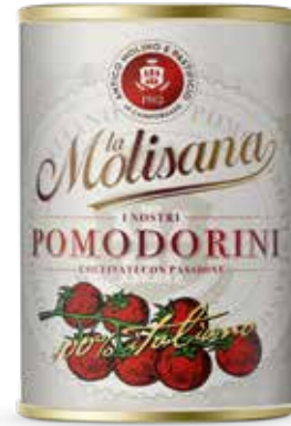
i Rossi Pomodorini 📦 400 g

Solo varietà pugliesi oblunghe , coltivate a livello del mare, raccolte in stagione e lavorate in giornata a ciclo continuo . I pelati sono immersi in un succo cremoso , hanno colore rosso vivo, profumo genuino e sapore delicato.