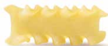
le Classiche Mafalda Corta trafilata al bronzo