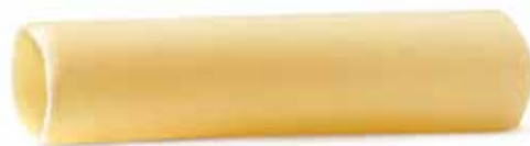
le Speciali Cannelloni trafilata al bronzo