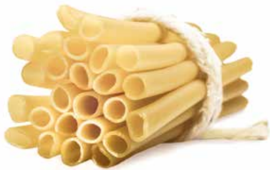
le Speciali Zitoni Napoletani trafilata al bronzo