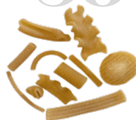
le Integrali Pasta Mista trafilata al bronzo