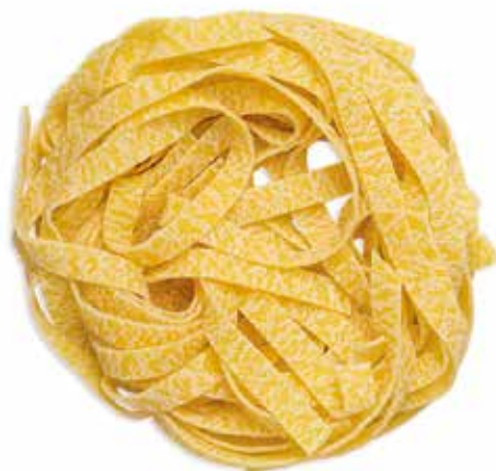
TAGLIATELLE ALL'UOVO --Trafilatura al Bronzo--