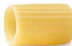
le Classiche Mezze Maniche trafilata al bronzo