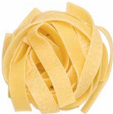
le Speciali Fettuccine trafilata al bronzo