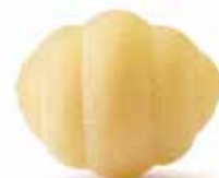
le Classiche Gnocchi trafilata al bronzo