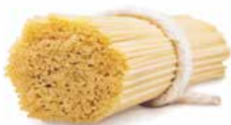
con farina di lupini Spaghetti trafilata al bronzo