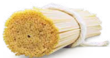
le Quadrate Spaghetti Quadrato trafilata al bronzo