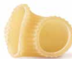
le Classiche Lumache Rigate trafilata al bronzo