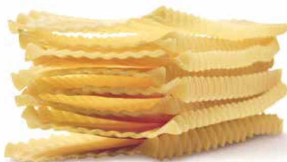
le Speciali Lasagne Festonate trafilata al bronzo