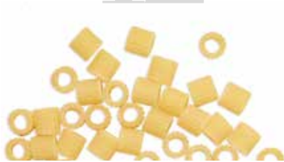
le Classiche Ditaloni Rigati trafilata al bronzo