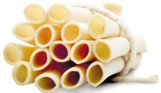
le Speciali Candele trafilata al bronzo