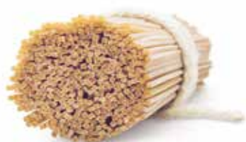
le Integrali Spaghetti Quadrato trafilata al bronzo