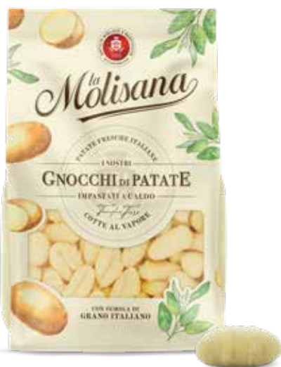
le Sfiziose Gnocchi di Patate Impastati a Caldo