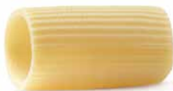
le Speciali Paccarielli Rigati trafilata al bronzo