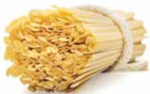
le Biologiche Fettuccine trafilata al bronzo