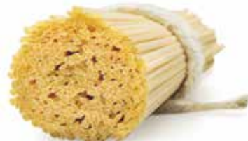
le Classiche Linguine trafilata al bronzo