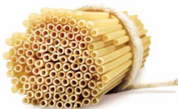
le Speciali Mezzi Ziti trafilata al bronzo