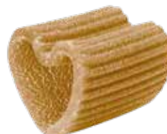
le Integrali Rigacuore trafilata al bronzo