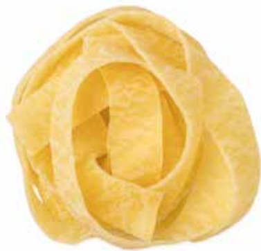
le Speciali Pappardelle trafilata al bronzo