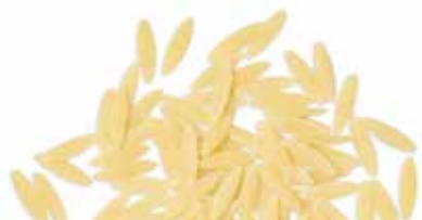
le Classiche Semi di Melone trafilata al bronzo