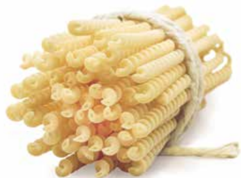
le Speciali Fusilli Lunghi Bucati trafilata al bronzo