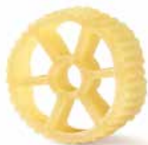
le Classiche Rotelle trafilata al bronzo