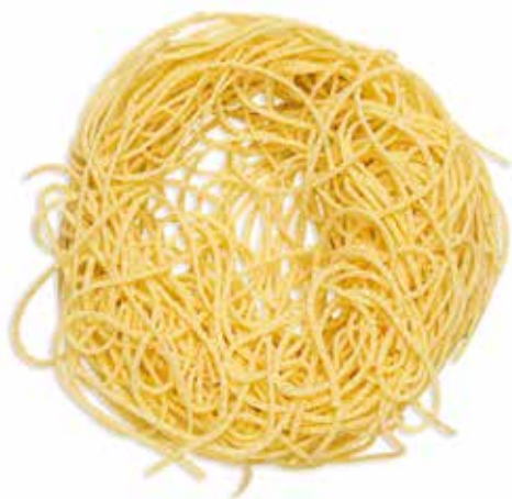
TAGLIOLINI ALL'UOVO --Trafilatura al Bronzo--