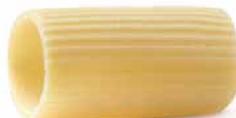
PACCARIELLI RIGATI --Trafilatura al Bronzo--