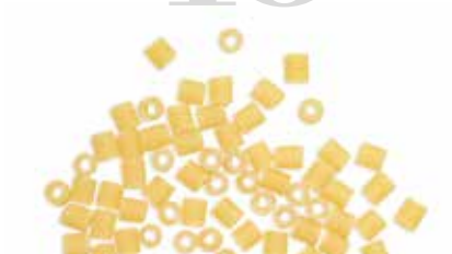
le Classiche Tubetti trafilata al bronzo