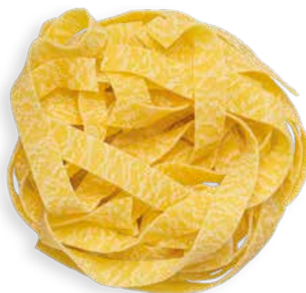
FETTUCCINE ALL'UOVO --Trafilatura al Bronzo--