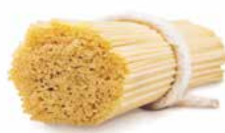
le Classiche Spaghetti trafilata al bronzo