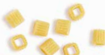
le Nuove Forme Cubetto trafilata al bronzo