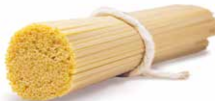
le Classiche Trighetto trafilata al bronzo