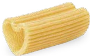
le Classiche Rigacuore trafilata al bronzo