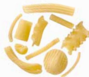
le Classiche Pasta Mista trafilata al bronzo