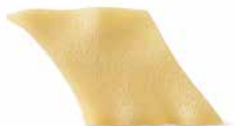
le Classiche Pantacce Toscane trafilata al bronzo