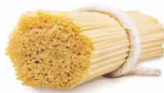
le Biologiche Spaghetti trafilata al bronzo