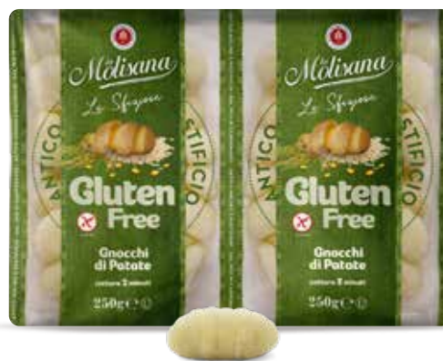
le Sfiziose Gnocchi di Patate Gluten Free