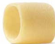
le Speciali Calamarata trafilata al bronzo