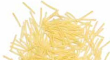
le Classiche Capellini Spezzati trafilata al teflon