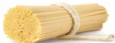
le Quadrate Spaghettino Quadrato trafilata al bronzo