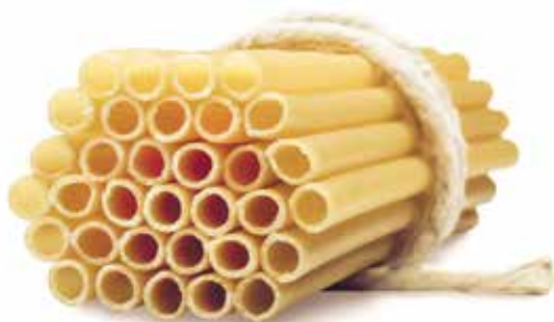
le Speciali Ziti Campani trafilata al bronzo