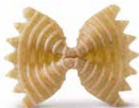
le Integrali Farfalle Rigate trafilata al bronzo