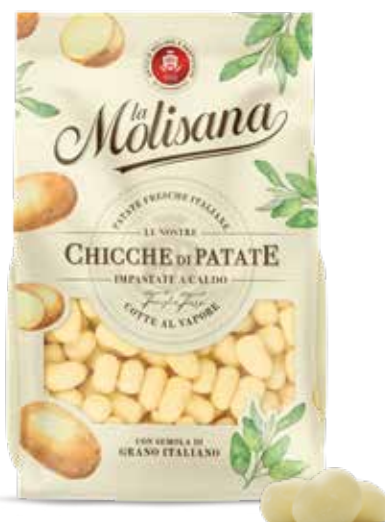
le Sfiziose Chicche di Patate Impastate a Caldo