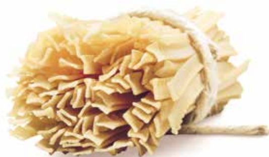
le Speciali Mezze Fettucce Ricce trafilata al bronzo