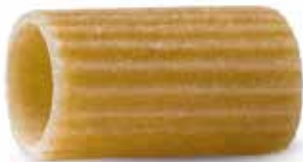
le Integrali Mezzi Rigatoni trafilata al bronzo