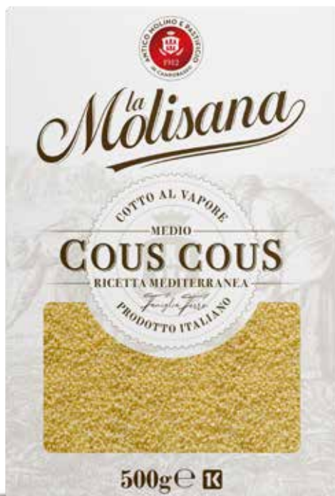
le Sfiziose Cous Cous 500 g

Per gli amanti delle cucine esotiche, un ottimo cous cous facile e veloce da preparare. Disponibile nelle versioni da 500 g e da 1000 g.