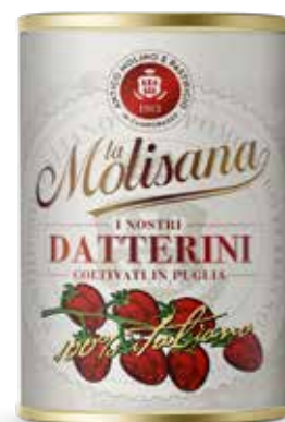
i Rossi Datterini 📦 400 g

Il valore aggiunto di questa polpa a pezzetti è nella materia prima : pregiati pomodori oblunghi tipici della Puglia. Un altro elemento distintivo è la sgrondatura che consente di ottenere un frutto completamente privo di semi e bucce .