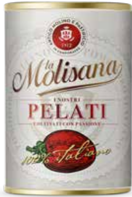
i Rossi Pelati 📦 400 g

LACCATA INTERNAMENTE CON APERTURA EASY OPEN - BPA-NI