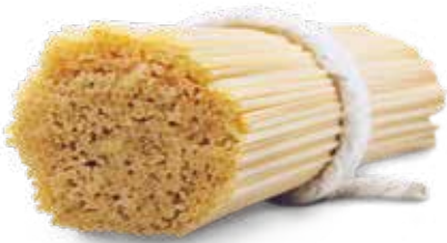
Spaghetti trafilata al teflon