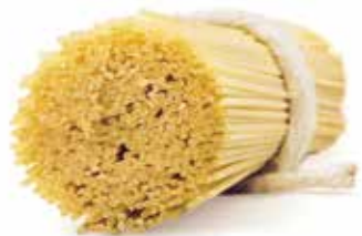
le Classiche Spaghetтини trafilata al bronzo