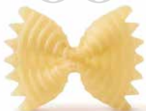
le Classiche Farfalle Rigate trafilata al bronzo