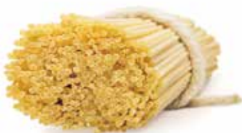
le Classiche Spaghetti Grossi trafilata al bronzo