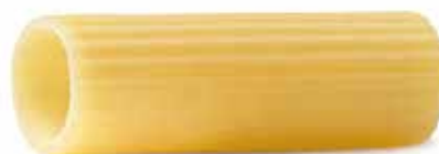
le Classiche Rigatoni trafilata al bronzo