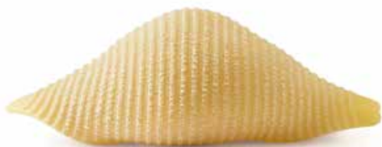
le Speciali Conchiglioni trafilata al bronzo