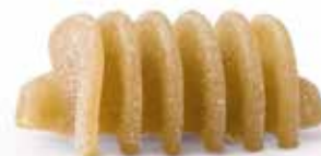
le Integrali Radiatori trafilata al bronzo