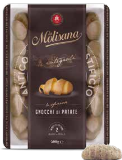
le Sfiziose Gnocchi di Patate Integrali