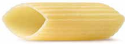
le Classiche Pennoni Rigati trafilata al bronzo