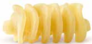
le Classiche Radiatori trafilata al bronzo