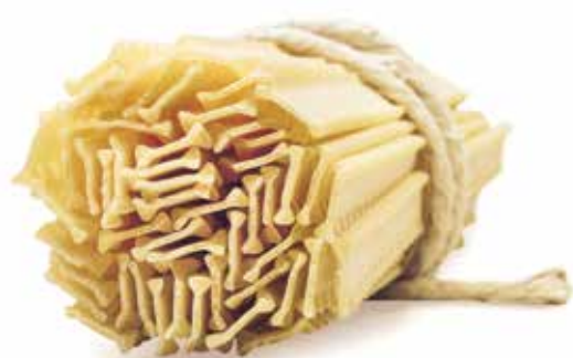
le Speciali Fettucce Ricce trafilata al bronzo