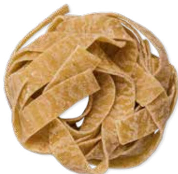
le Integrali Fettuccine trafilata al bronzo