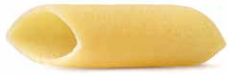
le Classiche Pennoni Lisci trafilata al bronzo