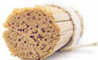
le Integrali Spaghetti trafilata al bronzo