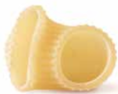
le Biologiche Lumache Rigate trafilata al bronzo