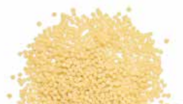
le Classiche Peperini trafilata al bronzo