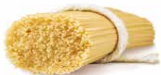
le Classiche Capellini trafilata al teflon