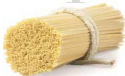
le Nuove Forme Spaghetti Quadrato Bucato trafilata al bronzo