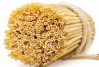
le Classiche Bucatini trafilata al bronzo